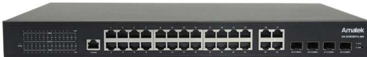
Рис 1.Общий вид коммутатора

Передняя панель содержит LED индикаторы и порты Ethernet.